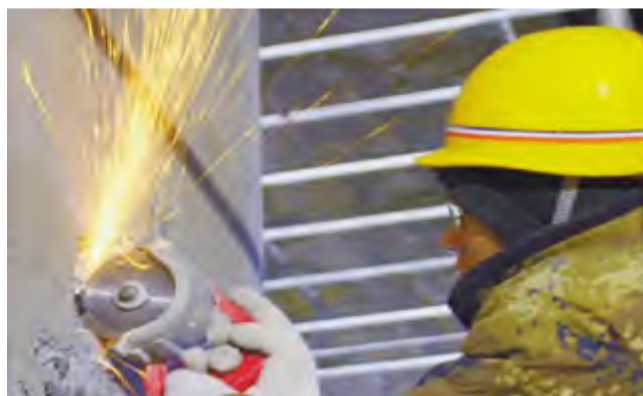
星光闪烁(会员作品 郭维摄)