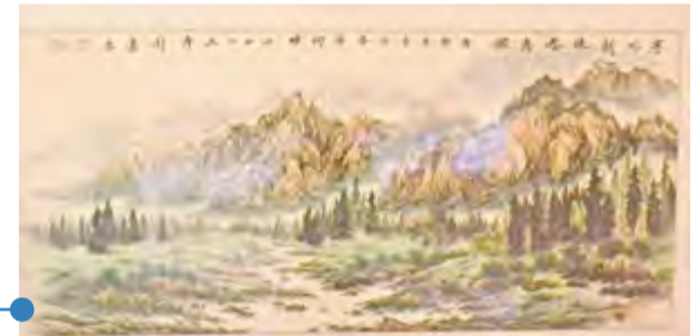
塞外新绿春意浓(绘画作品)建科院 周建良