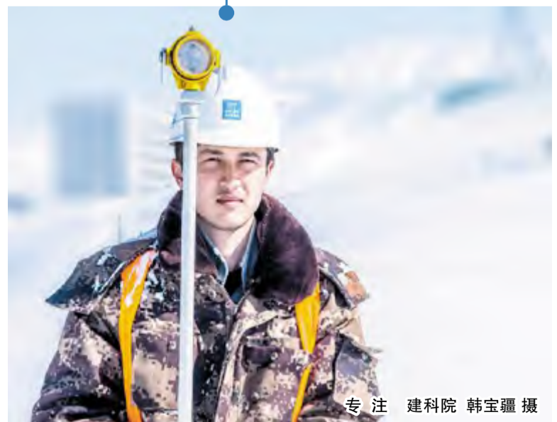
专注 建科院 韩宝疆 摄