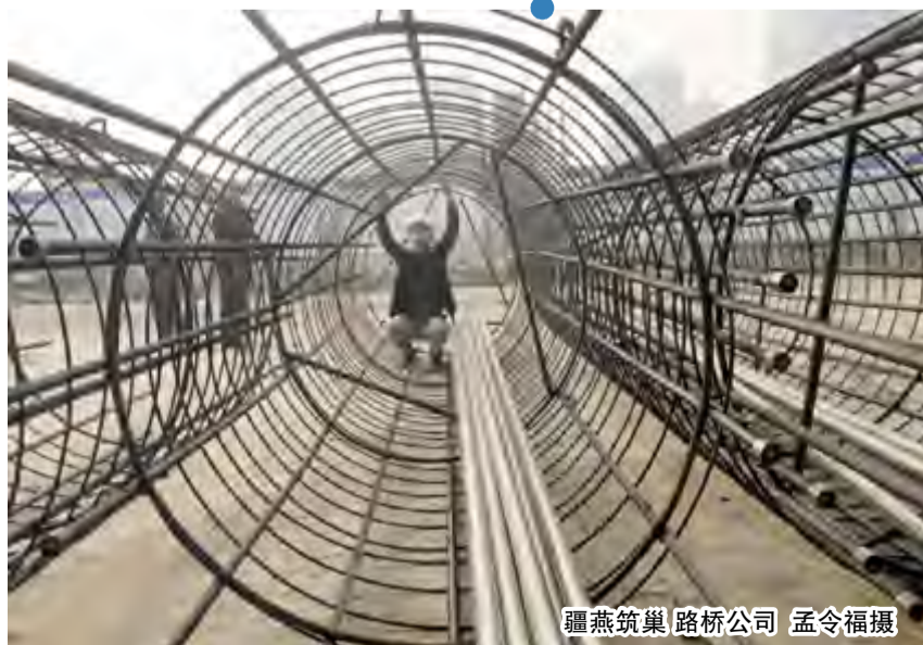
疆燕筑巢 路桥公司 孟令福摄