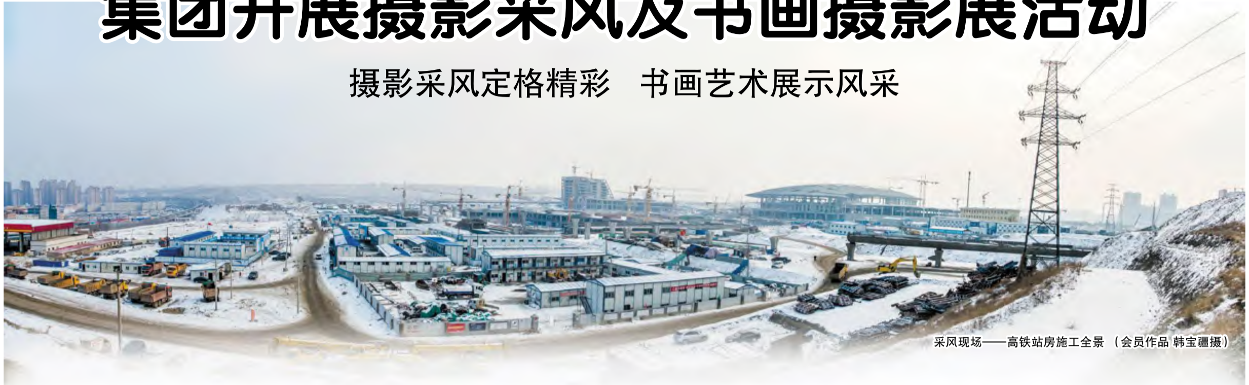
采风现场——高铁站房施工全景

本报讯(记者 王国栋 通讯员 徐丽萍 蔡永丽)“我聚焦、我践行、我精彩”。岁末年初,伴随着浓郁的迎新气息,集团为深入做好《十典九章》宣贯工作,开展了一系列内涵丰富的企业文化建设活动,使中建文化融入到了员工一言一行当中,起到了外塑于行内化于心的宣贯实效。