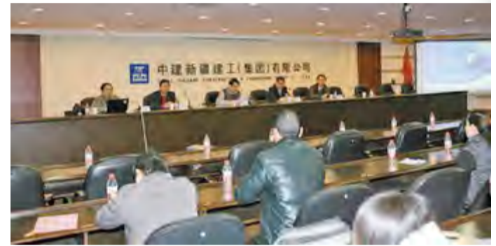
摄影协会成立大会