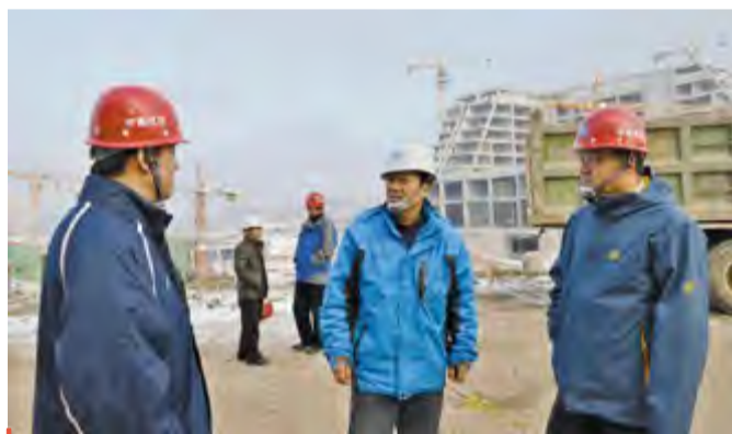
领导亲临摄影采风现场