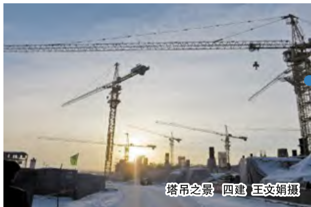
塔吊之景